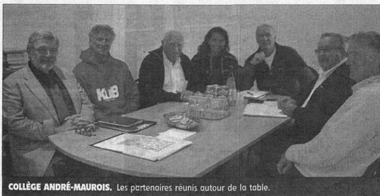
COLLÈGE ANDRÉ-MAUROIS. Les partenaires réunis autour de la table.

Nouveauté cette année, le lancement du niveau 6 e , 5 e , qui permettra à 16 élèves de cette catégorie d'âge de pratiquer, en plus de leur cursus scolaire, 2 heures de football par semaine.