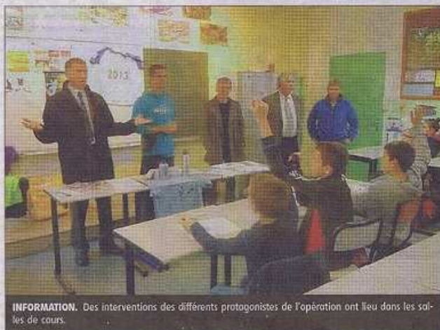
INFORMATION. Des interventions des différents protagonistes de l'opération ont lieu dans les salles de cours.

Un courrier d'explication aux parents et des dépliants sur l'UNSS (Union nationale du sport scolaire) ont permis de diffuser