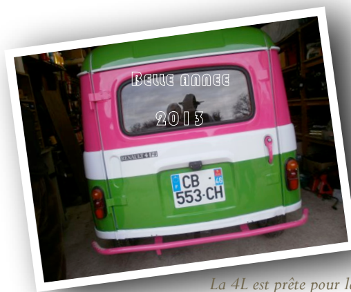
La 4L est prête pour le flocage