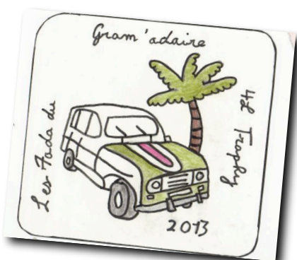
Le logo choisi pour l'Association